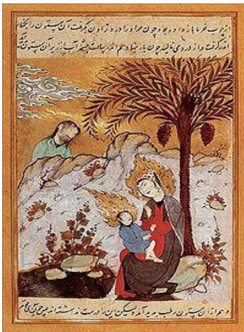
Η γέννηση του Χριστού από την παρθένο Μαρία στη Βηθλεέμ κάτω από τη χουρμαδιά

Η Παρθένος Μαρία είναι η ενάρετη μητέρα του Ιησού, γι' αυτό και όλη η ζωή της ήταν γεμάτη θαύματα όπως το παραπάνω. Γι' αυτό και οι μουσουλμάνοι τη σέβονται ως μητέρα του Μεσσία, αλλά όχι ως θεοτόκο. Όμως την προσφωνούν «Δέσποινά μας, κυρία μας Μαριάμ». Μαζί με τον Ιησού είναι σύμφωνα με το Κοράνι το «σημείο του σύμπαντος κόσμου».